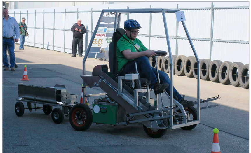
4. ábra A 2. helyezett („A kocka el van vetve”, BMGE) gép a szlalompályán

Cikkünkben alapvetően a verseny döntőjéről számoltunk be, amely az akár egy éves munka befejező eseménye volt. Komoly tervezési, építési munka képezte a feladatok zömét. A rendező ennek a folyamatnak a mérföldköveit is értékelte: a legszínvonalasabb tervek benyújtói támogatást (75 000 Ft) kaptak arra, hogy alkotásukat megépítsék. A sikerességben nagy sze-