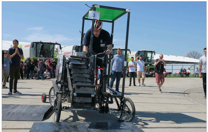
5. ábra Ha nem volt elegendő lendület, jó konstrukcióval is leküzdhetetlen volt ez az akadály (3. helyezett, SZIE-Company)

repet játszottak a gondosan kidolgozott műszaki részletek (6. ábra).