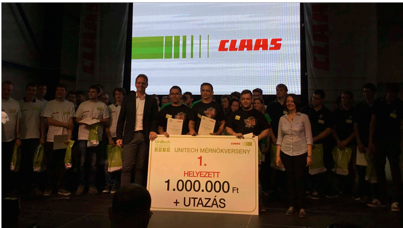
8. ábra Az ünnepélyes eredményhirdetésen a győztes „Aszéliszív” csapat