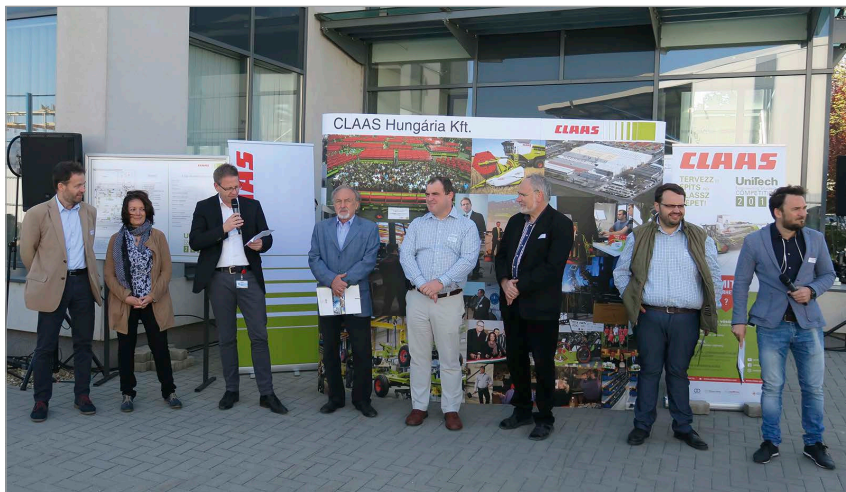
1. ábra A gyár vezetői, a zsűri tagjai és a programvezetők a kora reggeli megnyitón

És valóban: a tavaly meghirdetett verseny szabályai biztosították a betakarító gép „leképezését” annak minden funkcionális egységével. „Csak” nem gabonát, hanem megfelelően elhelyezett fakockákat és teniszlabdákat kellett a lehető leggyorsabban betakarítani, a „terményt” szeparáltan külön tárolókba gyűjteni (2. ábra). Talán ez a feladat volt a legnehezebb, ezért lehetett a legtöbb pontot kapni. Nem volt könnyű a