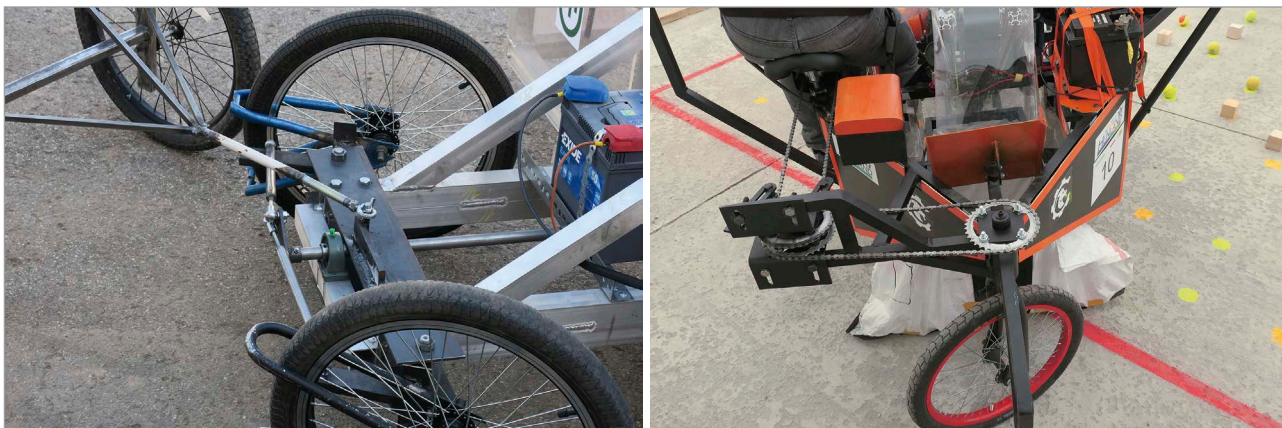
7. ábra Néhány kormány szerkezet megoldás

megoldásokat: szenzoros vezérlőegységeket, fedélzeti számítógépet, vagy egyszerűen folyamatos telefonos információátadást a versenyző és a „külső” irányító között. Innovatív megoldás volt az elektromos meghajtású kombájn. A szabályok szerint a kombájn mozgatását csak emberi erővel lehetett megvalósítani, tárolt energiával (akkumulátor, sűrített levegő) csak a segédhajtásokat lehetett üzemeltetni. Különdíjat kapott az a megoldás, amely a vezető serény láb munkájával termelt áram segítségével, egy nagy kapacitású kondenzátor beiktatásával, végül elektromos meghajtással működött (SZEdeTT vetett, Széchenyi István Egyetem)!